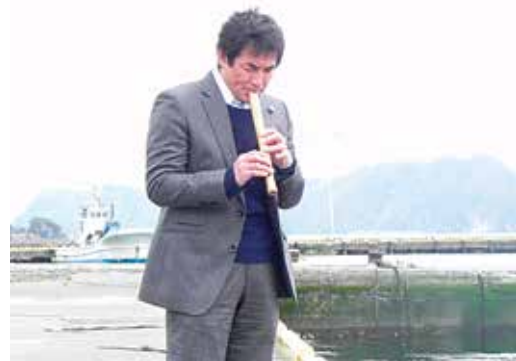
2012年4月22日 釜石埠頭にて祈りのケーナ